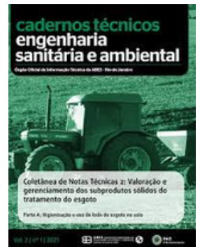
ABES BRASIL REVISTA ESA