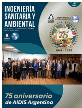
AIDIS ARGENTINA REVISTA ISA