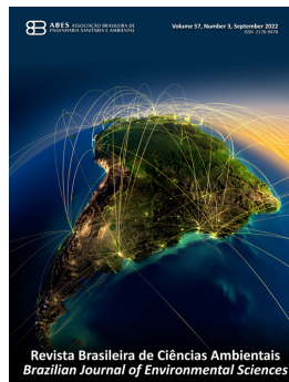
ABES BRASIL REVISTA BRASILEIRA DE CIENCIAS AMBIENTAIS