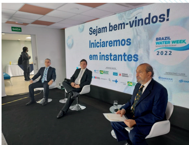
Brazil Water Week 2022

A Brazil Water Week foi tornada online em 2020 por motivo da pandemia. O formato, transformado em uma transmissão semelhante a uma programação de televisão contínua de cinco dias, mostrou-se um sucesso. Tivemos mais duas edições, em 2022, e há poucas semanas, em maio último. O formato se consolidou. Construída em um processo de parcerias com diversas entidades, nacionais e internacionais, o que garante a diversidade e a riqueza do conteúdo, a BWW aumentou a cada ano a participação externa, tornando-se o principal canal da ABES para troca internacional de conhecimento.