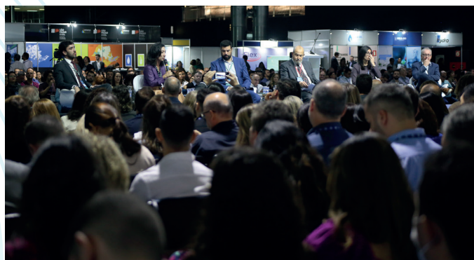
32º Congresso Brasileiro de Engenharia Sanitária e Ambiental