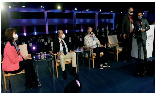
31º Congresso Brasileiro de Engenharia Sanitária e Ambiental

Parte essencial da atuação da ABES são os eventos de discussão e difusão tecno-científica. O principal é o Congresso Brasileiro de Engenharia Sanitária e Ambiental – CBESA. O 31º CBESA em 2021, em Curitiba, foi, pode-se dizer, um feito heroico, em plena pandemia, realizado de modo híbrido, com 3.500 participantes, quase metade presencialmente; conseguimos fazer um Congresso marcante, em condições tão difíceis. Já o 32º CBESA em Belo Horizonte, no ano passado, foi um grande congresso de retomada, com 7.000 participantes e uma FITABES vibrante. Nas duas edições os painéis temáticos e os trabalhos técnicos foram de grande qualidade, mantendo o compromisso de nossa entidade com o debate e com a troca e difusão de conhecimento.