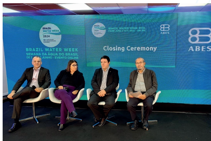
Brazil Water Week 2024